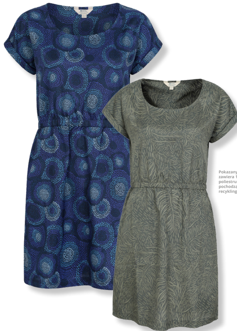
Pokazany produkt zawiera 100% poliestru pochodzącego z recyklingu

Nasi dostawcy pozyskują tkaniny pochodzące z recyklingu w naszym imieniu i dostarczają nam certyfikaty zakresu fabrycznego i transakcji dla gotowego produktu jako dowód roszczenia.